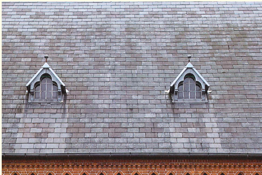
Tagflade på skib med mønsterlagt skifertag. Mønsteret er flere steder brudt som følge af løbende vedligeholdelse med udskiftning af plader.

NB! Vær opmærksom på, at kirkens parkeringsplads er lukket i hele byggeperiode.