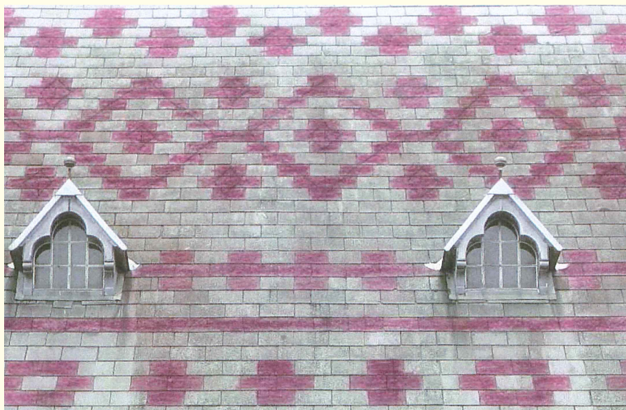
Det originale mønster på skifertag, som her er optegnet, rekonstrueres med nye tagplader.